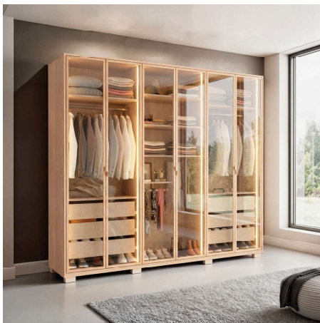
Roupeiro com portas em vidro reflecta e iluminação interna em led – Móveis Édez