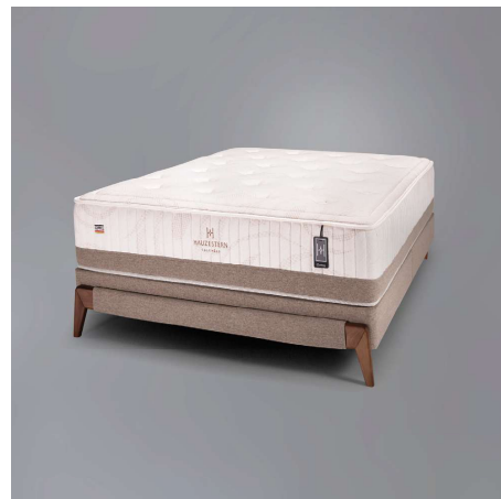
Colchão Gipfel – HAUZESTERN Colchões

Herval Móveis e Colchões, HAUZESTERN Colchões e Móveis Édez destacam novidades em mobiliário durante a feira, que ocorre de 15 a 18 de junho