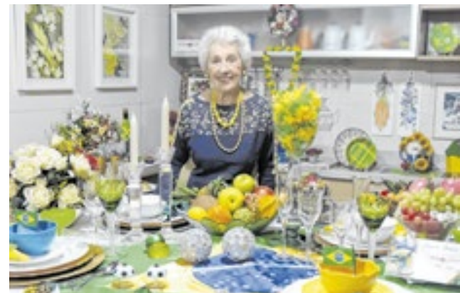
Heda junto de sua mesa decorativa para a Copa do Mundo

Os elementos presentes na decoração das mesas incluem frutas tropicais, flores em tom amarelo e verde e castiçais com velas brancas. A montagem da mesa, conforme as práticas de