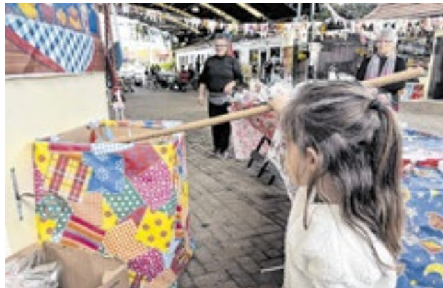
Concentração e diversão para os pequenos no sábado (27)