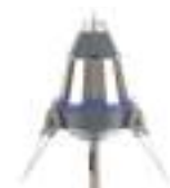
TS25 25 microssegundos