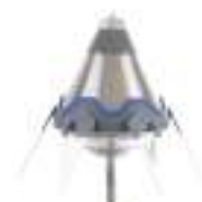
S60 60 microssegundos