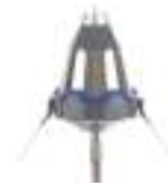
TS10 10 microssegundos