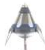
S40 40 microssegundos