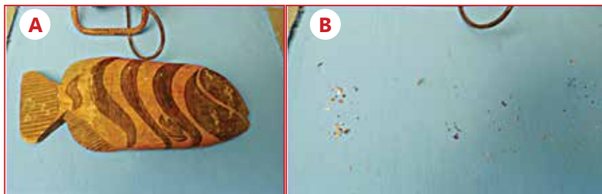
Figura 1 - (A) Colônia de Rhipicephalus sanguineus estabelecida atrás de quadro; e (B) retirado o quadro, notam-se carrapatos em diversas fases de vida aderidas à parede

Vendo a expressão perplexa de Ricardo, o veterinário continua: todos os carrapatos colocam ovos e fazem parte do ciclo de vida no ambiente, e preci-