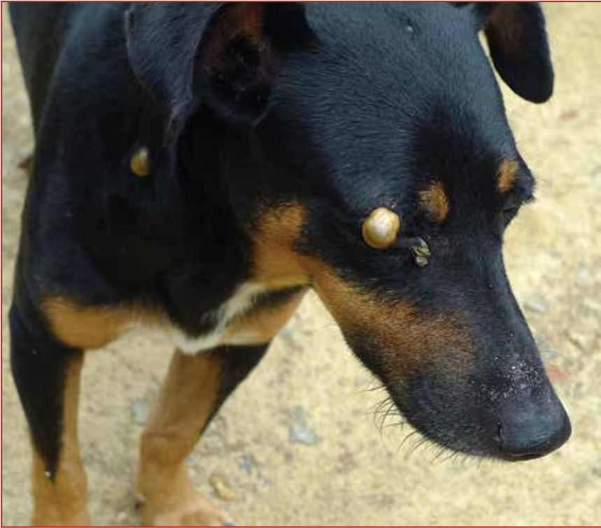
Figura 3 - Infestação por adultos de Amblyomma ovale em cão. Notam-se fêmeas em ingurgitamento pleno

de alimentação; então, para Fernanda a recomendação é que use calça e camisa de mangas longas durante as caminhadas na mata e que vistorie o corpo a cada quatro horas, para retirar qualquer carrapato que eventualmente tenha se fixado na sua pele.