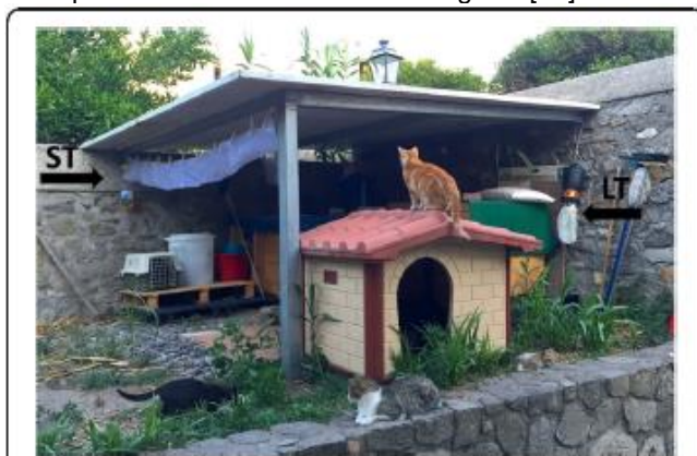
Fig. 2. Captura de flebótomos nas dependências de uma residência na ilha de Lipari. Uma armadilha luminosa (seta LT) e armadilhas pegajosas (seta ST) foram montadas mensalmente e deixadas funcionando por dois dias consecutivos em cada um de oito locais.

Armadilhas luminosas e pegajosas foram usadas para monitorar a presença e a atividade de flebótomos durante o período do estudo. As armadilhas foram colocadas mensalmente em oito locais diferentes (cinco em Lipari e três em Vulcano) de maio a dezembro de 2015. As armadilhas foram colocadas próximo das residências em que gatos foram incluídos no estudo (Fig. 2). Em cada local e para cada sessão de captura, uma armadilha luminosa e armadilhas pegajosas para um total de 2 m 2 foram preparadas e deixadas operando por 2 dias consecutivos (armadilhas pegajosas) ou 2 noites consecutivas, ou seja, das 6:00 da tarde às 7:00 da manhã (armadilhas luminosas). A atividade de captura foi concluída em cada local após duas sessões de captura negativas consecutivas. Os flebótomos coletados foram separados a partir de outros insetos com o auxílio de um estereomicroscópio, foram diferenciados por sexo e foram armazenados em frascos que continham etanol a 70%, de acordo com o local e a data de captura. As amostras de flebótomos foram preparadas para observação microscópica conforme descrito em outro local [29] e foram identificadas no nível de espécie utilizando chaves morfológicas [30].