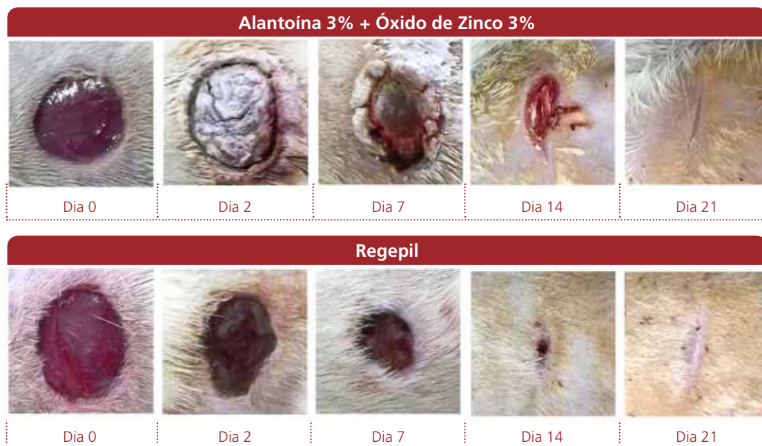
Imagens do fechamento das feridas tratadas com as formulações a base de Alantoína 3% + Óxido de Zinco% e de Asiaticosídeo 0,2% e Tartarato de Ketanserina 0,345% (produto Regepil).