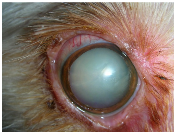
Figura 4: Olho direito de paciente canino portador de DM apresentando catarata madura.

O objetivo do tratamento é eliminar as manifestações clínicas do DM além de evitar suas complicações crônicas. Destacam-se entre as complicações mais comuns a uveíte, catarata (Figura 4), pancreatite crônica, infecções recorrentes (principalmente em trato urinário, pele e cavidade oral), lipidose hepática, hipoglicemia, hipertensão e cetoacidose diabética. Outras complicações tais como neuropatia periférica, glomerulopatia, retinopatia, insuficiência pancreática exócrina, paresia gástrica e diarreia crônica são incomuns.