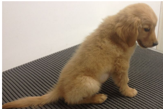
Figura 1: DM juvenil em canino, macho, Golden Retriever, três meses de idade, no momento do diagnóstico.

A incidência do DM varia entre 1:100 e 1:500. A doença acomete cães com idades entre quatro e 14 anos, com pico de prevalência entre sete e 10 anos, sendo as fêmeas mais acometidas em relação aos machos. O DM juvenil (diabetes insulino-deficiente) ocorre em cães com menos de um ano de idade, porém é de ocorrência rara (Figuras 1 e 2). Entre as raças acometidas destacam-se Poodle, Schnauzer, Beagle, Spitz, Lhasa Apso, Labrador, Golden Retriever, Pastor Alemão, Cocker Spaniel, Rottweiler, Pastor de Shetland, Daschund, Yorkshire. Comumente, o DM também é diagnosticado em cães sem raça definida.