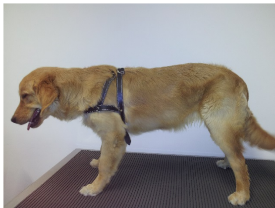
Figura 2: DM juvenil em canino, macho, Golden Retriever, nove meses de idade, decorridos seis meses de insulino-terapia.