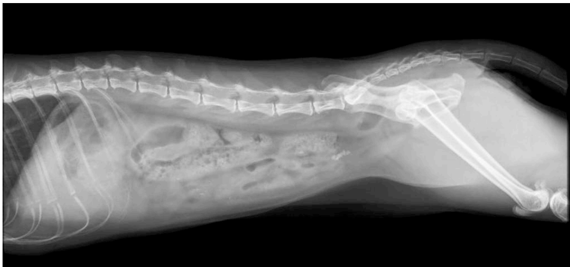
Figura 2 – exame radiográfico do mesmo animal correspondente à figura 1, evidenciando múltiplos urólitos em vesícula urinária.

O magnésio é reconhecido como um inibidor natural de agregação do oxalato de cálcio em diversas espécies. Em gatos, dietas com baixos índices de magnésio estão associadas ao aumento do risco de desenvolvimento de urólitos de oxalato de cálcio. O mesmo ocorre com os níveis de fósforo. Dietas com níveis baixos de fósforo tornam os gatos cinco vezes mais predispostos à urolitíase (a hipofosfatemia ativa a vitamina D, gerando aumento da absorção intestinal e excreção renal de cálcio).