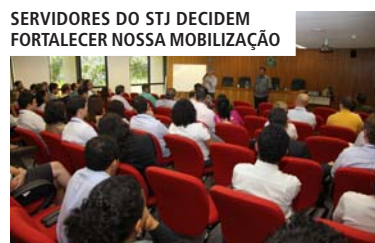
SERVIDORES DO STJ DECIDEM FORTALECER NOSSA MOBILIZAÇÃO