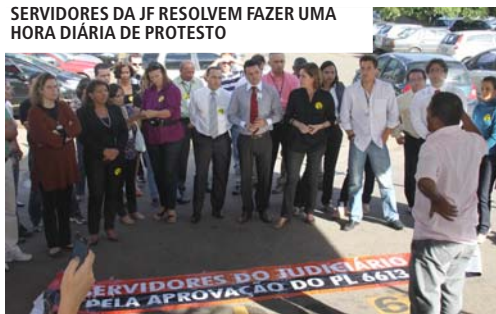
SERVIDORES DA JF RESOLVEM FAZER UMA HORA DIÁRIA DE PROTESTO