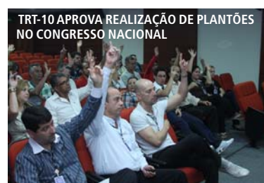
TRT-10 APROVA REALIZAÇÃO DE PLANTÕES NO CONGRESSO NACIONAL