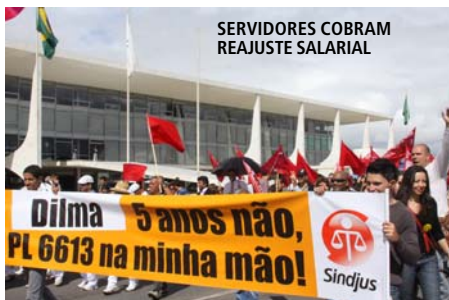
SERVIDORES COBRAM REAJUSTE SALARIAL