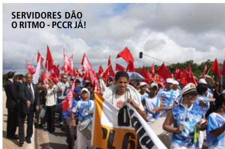
SERVIDORES DÃO O RITMO - PCCR JÁ!