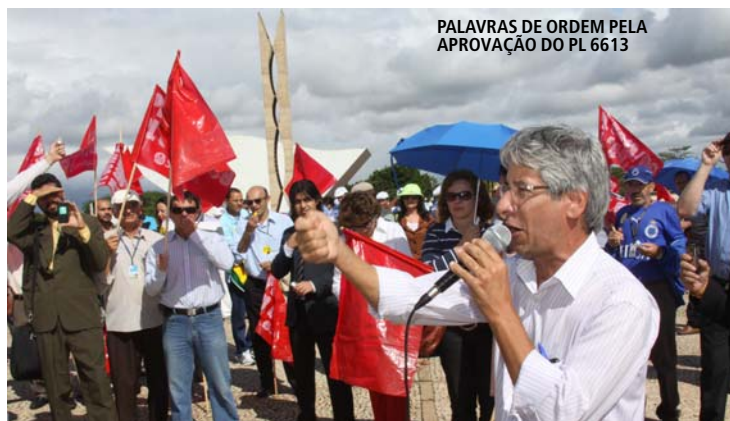
PALAVRAS DE ORDEM PELA APROVAÇÃO DO PL 6613