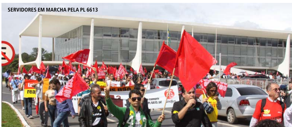
SERVIDORES EM MARCHA PELA PL 6613