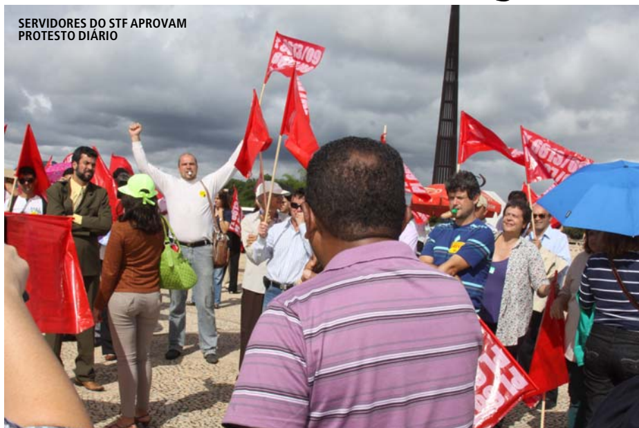
SERVIDORES DO STF APROVAM PROTESTO DIÁRIO