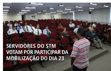
SERVIDORES DO STM VOTAM POR PARTICIPAR DA MOBILIZAÇÃO DO DIA 23