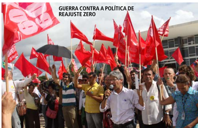
GUERRA CONTRA A POLÍTICA DE REAJUSTE ZERO