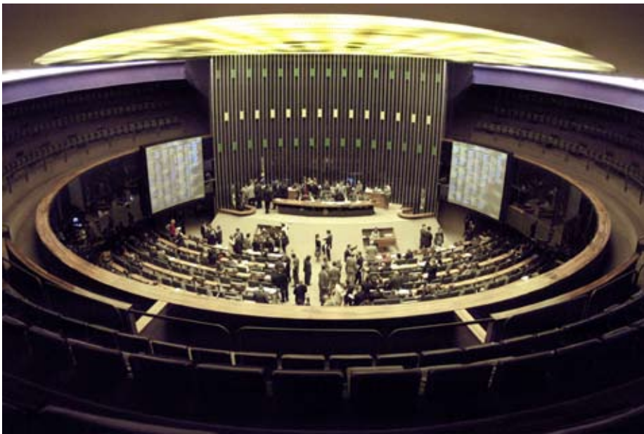
Falta de quorum impediu a votação do PLN 11/06 nos últimos dias

Os PCSs dos servidores do Judiciário e do Ministério Público do DF (aprovados em setembro) continuam dependendo da votação do PLN 11/06, que garante verba para os planos, para seguir à sanção presidencial. Mas isso pode acontecer só no início da próxima semana.