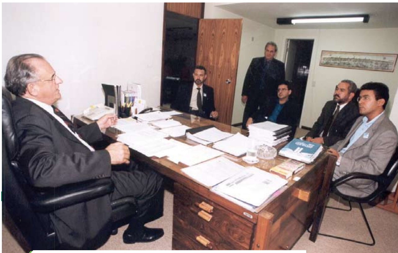
Diretores da Fenajufe negociam o segundo PCS com o ministro Nelson Jobim, em 2002

A elaboração de um PCS passou a ser a prioridade das lutas da categoria.