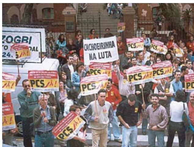
Gaúchos tomam as ruas de Porto Alegre para garantir o PCS

Somente no ano seguinte, com a maior e mais forte greve nacional da história do Judiciário, e depois de muitas rodadas de negociação das lideranças sindicais em Brasília,