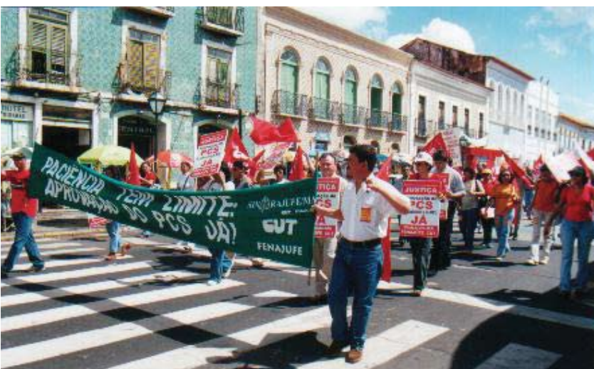
Servidores do Judiciário maranhense percorrem as ruas de São Luiz na Luta pelo PCS

gorias do funcionalismo público federal, aderindo à greve por tempo indeterminado, realizada em abril e maio daquele ano. A aprovação do PL 1059/95 foi incluída na pauta de reivindicações, que incluía o reajuste emergencial de 46,19% e o combate às reformas administrati-