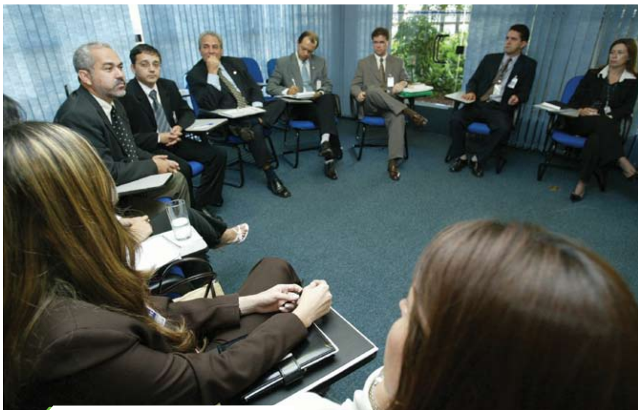
Comissão é instalada no dia 28 de maio de 2004

e serviços do Judiciário. Como é patente, a terceirização tem tomado conta dos tribunais. Além de ferir os princípios que regem a administração pública – universalidade do