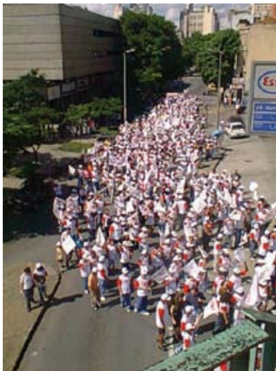
A marcha dos mineiros em 2002

Em 1996, a Fenajufe e os sindicatos de base se uniram às outras cate-