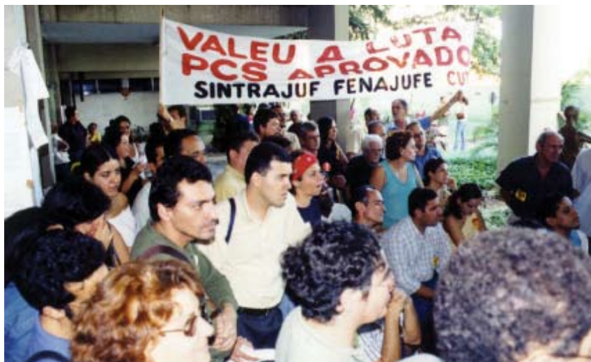
Servidores de Pernambuco comemoram a vitória em 2002

Henrique Cardoso. Estava na hora de pedir a revisão do PCS.