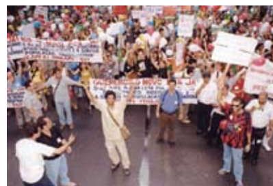
Servidores do Rio exigem aprovação do PCS em 2002

no acesso aos cargos e funções comissionadas e o fim do nepotismo. Naquele ano, um projeto de lei (PL 4212/89) com alguns desses objetivos, elaborado pelos tribunais superiores, sem a participação dos servidores, foi encaminhado ao