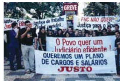
A categoria nas ruas de Londrina em 2002

Como dizia o poeta, “quem sabe faz a hora, não espera acontecer”. Por isso, mãos à luta. Até a vitória!