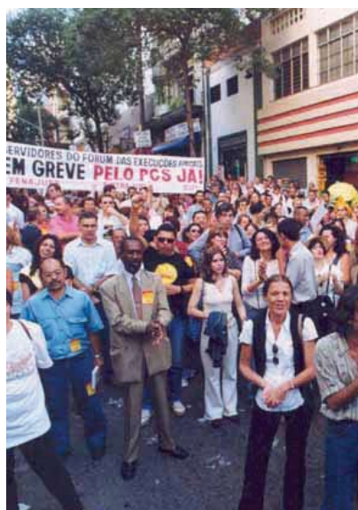
Paulistas cruzam os braços e exigem PCS, já!

Novamente, os servidores do Judiciário uniram-se aos demais setores do serviço público federal, para reivindicar o reajuste geral de salários e exigir a reestruturação do PCS. Novas pressões foram feitas pela Fenajufe e pelo Sindjus-DF junto à cúpula do Judiciário, tendo-se formado grupos de trabalho, com representantes dos trabalhadores e das direções dos tribunais superiores para avaliar a realidade salarial e as condições de trabalho.