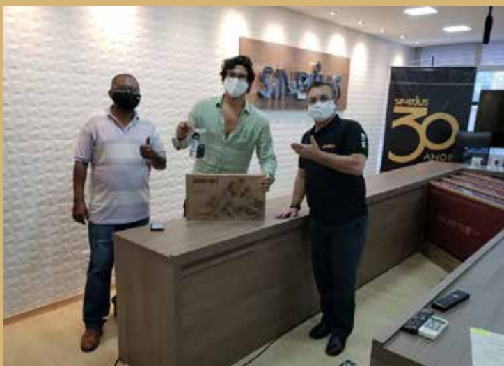
Pablo Tarrago Fonseca Giordiano – STJ NOTEBOOK SAMSUNG 15,6 POLEGADAS