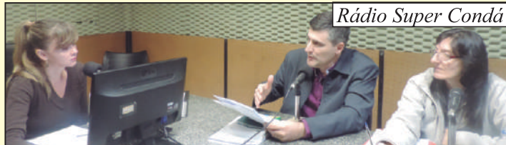
Rádio Super Condá

O Sindicato agradece a Direção das rádios pelo espaço colocado a disposição da categoria.