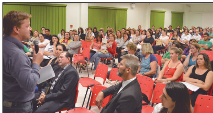
A Assessoria Jurídica do Sindicato acompanhou o processo e apontou as inconstitucionalidades do Projeto

Outro absurdo é que com a incorporação do valor da função de confiança e da diferença do cargo em comissão com a VPNI, a Prefeitura dobraria esse custo porque quem tem 10 anos passaria a receber esse valor incorporado e seria pago novo valor para esse servidor ou para o novo que o substituiria na função.