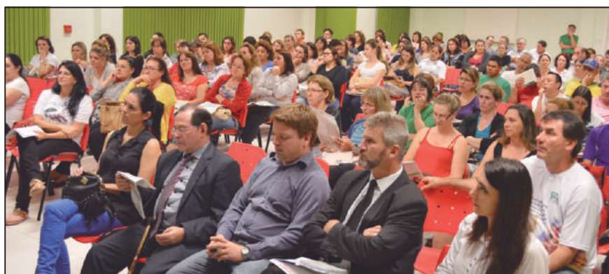
Servidores lotaram auditório do Sindicato na Assembleia

Para mobilizar a categoria uma Assembleia Geral Extraordinária foi convocada pelo Sindicato no dia 10 de junho, com a participação dos Servidores Municipais.