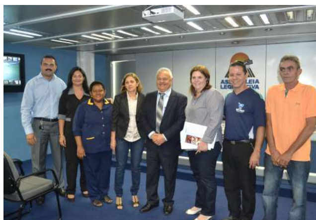
↳ Diretores do SECVGAF prestigiaram o evento

Durante o debate sobre a alta rotatividade do setor, o