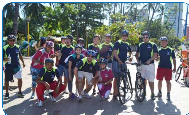
Os participantes da Pedalada durante parada na Avenida Beira Mar

O Sindicato realizou em 24 de agosto a III Pedalada SECVGAF. A terceira edição do passeio ciclístico teve como tema “Esporte é saúde”, e foi esta a marca de uma manhã de alegria e disposição para a atividade física para todos os participantes.