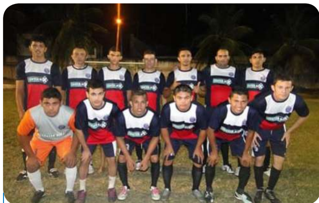
↳ Equipe do Supermercado Centerbox