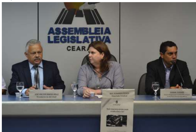
↳ O Presidente do SECVGAF defendeu a observância dos impactos para o trabalhador e para a economia