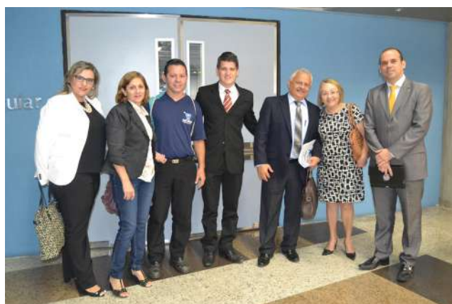
↳ A assessoria jurídica do SECVGAF presente na Audiência Pública