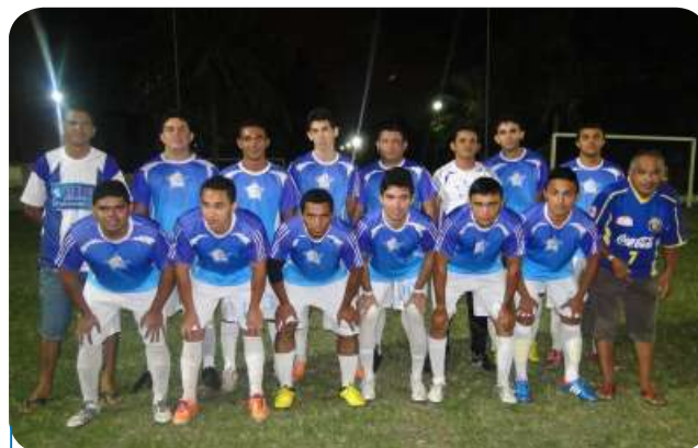
↳ Equipe do Supermercado Estrela

A Copa SECVGAF de Futebol Society está de volta! A edição 2014 do torneio que reúne empregados de supermercados de Fortaleza e Região Metropolitana conta com 16 equipes participantes. A disputa começou em 13 de agosto.