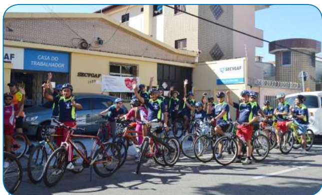
A turma da pedalada esperando a largada inicial